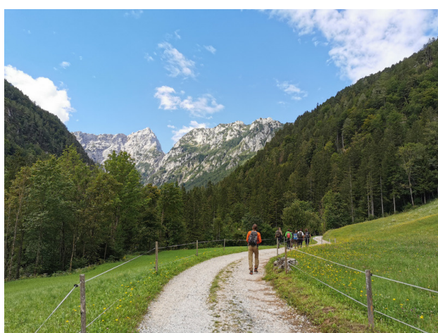
Foto : Logar Tal, Kamnik-Savinja Alpen, Slovenien.

Im 7. ALPTREES Steering Group Meeting am 16. Juni stellte ein Team der BOKU Wien eine neue Umfrage für Experten in der Holzindustrie vor. Sie wird in allen fünf Länder des Alpenraumes durchgeführt. Spezielle Anwendungsbereiche für Holz, wie im Holzinstrumentenbau oder der Wohnraumgestaltung sollen erfasst werden. Alle interessierten Produzenten die mit Holz aus nicht heimischem Baumbestand arbeiten sind eingeladen daran teilzunehmen im link: https://drive.google.com/file/d/1WqZqPtfCnbYR2Z_R9MIKe_gXx60Xtrud/view