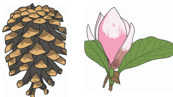
Pinuskegel , Pinus Nigra 2. Blume der Magnolia x Soulangiana

Für die Veröffentlichung unseres ersten Handbuchs haben wir 100 Illustrationen von nicht heimischen Baumarten fertigen lassen, die zusammen mit Fotos und Hintergrundinformationen einen leichten und vielseitigen Reisebegleiter zur Identifizierung nicht heimischer baumarten in Stadt und Wald darstellt. Er wird als Fächer als auch online zur Verfügung stehen. Für Vorbestellungen kontaktieren Sie uns bitte!