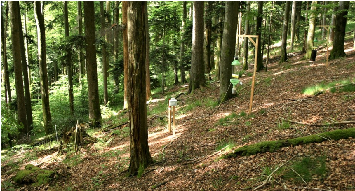
Abbildung 2. Das Zentrum einer 50 m × 50 m großen Probefläche. Zu sehen sind zwei Kreuzfensterfallen, Temperaturlogger und Markierungspfosten. Die Bodenfallen sind mit dünnen Stäben markiert und auf dem Bild kaum zu erkennen.